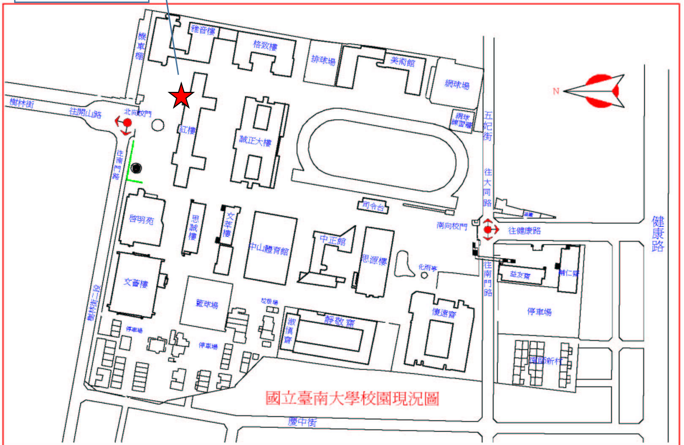
國立臺南大學校園現況圖