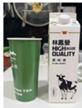
乾淨牛奶瓶或 乾淨飲料杯大約900ML